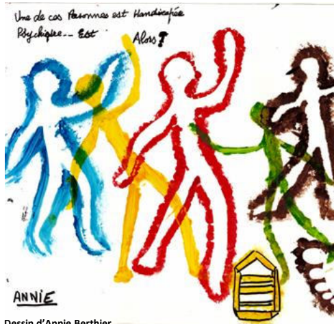
Dessin d'Annie Berthier

Un de ces artistes est handicapé psychique, Et Alors !